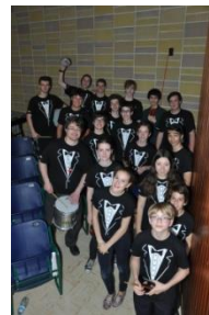
Nos musiciens du Stage Band.