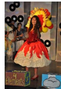
Une présentation énergique.