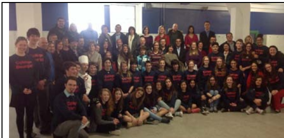
Notre groupe de voyageurs.

Une conférence de l'agence de voyage, pour donner les derniers détails avant le départ, se tenait par la suite.