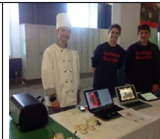
Dégustation de « Fish & chips ».