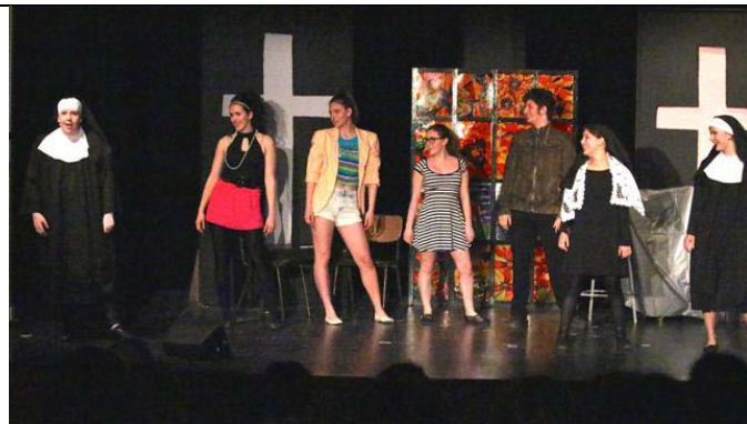
Un spectacle fort apprécié!

Bravo aux responsables et aux élèves impliqués!