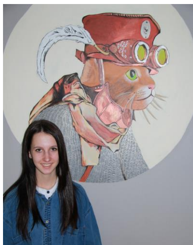
Trois des élèves-artistes devant leur murale