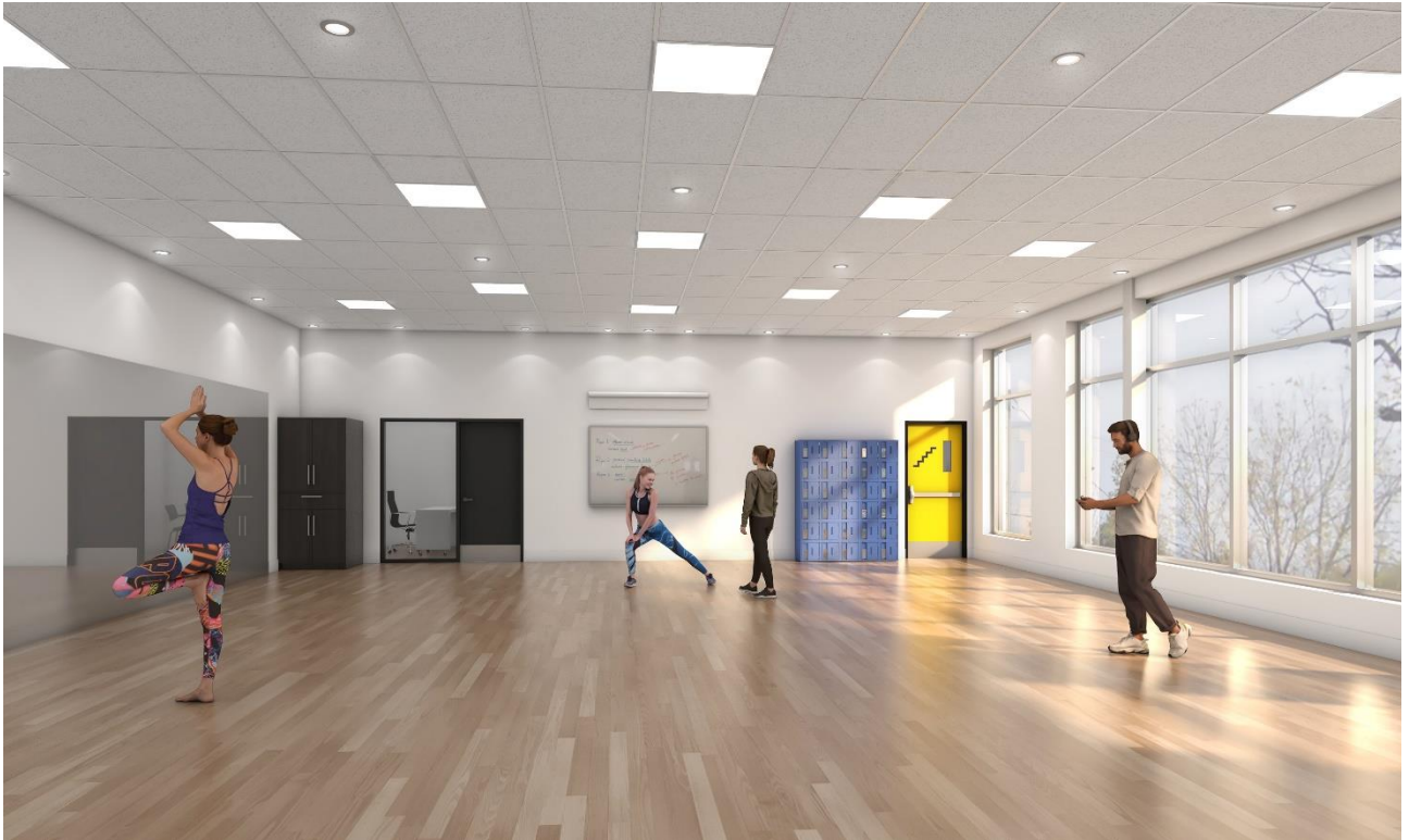
Nouvelle salle de danse