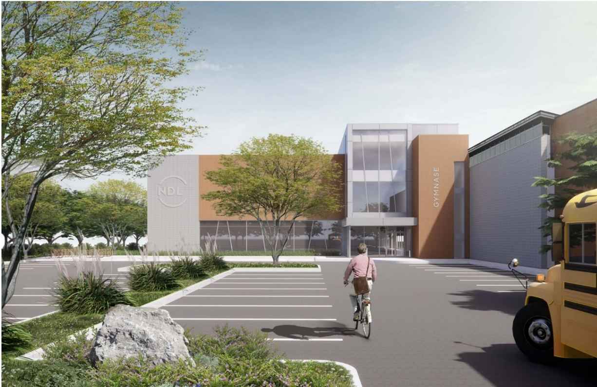
Façade de la nouvelle section du bloc sportif (vue de la rue Tiffin)